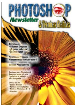
Portada realizada en Photoshop 6 con la acción Bosquejo.atn

Páginas Web: www.photoshop-newsletter.com www.freehand-newsletter.com